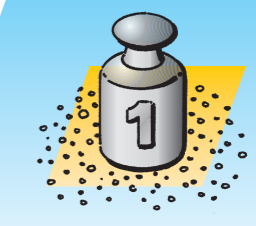
Abgestreute Fläche mit 1 kg Sand/Schlacke

Bei der gleichen Gewichtsmenge kann mit FIBOSTREU eine deutlich größere Fläche abgestreut werden als z.B. mit Sand, Splitt oder Schlacke: