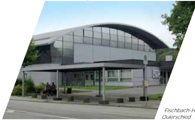
Fischbach-Halle in Quierschied